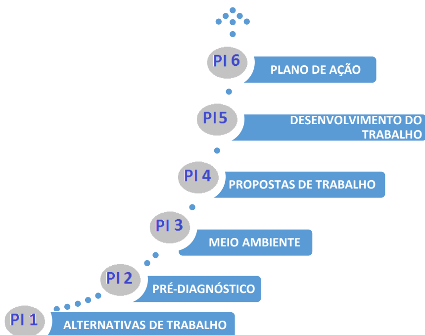
Figura 1 – Desenvolvimento do Projeto Integrador (elaborado pelo Prof. Laerte Zotte)

Este modelo de Projeto Integrador será o TG (Trabalho de Graduação) II, contendo as 6 etapas apresentadas na figura a seguir.